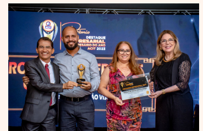
RODOLFO DE FREITAS GRÁFICA RÁPIDA Comunicação Visual