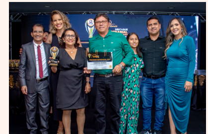
COMERCIAL OLIVEIRA Loja de Departamentos