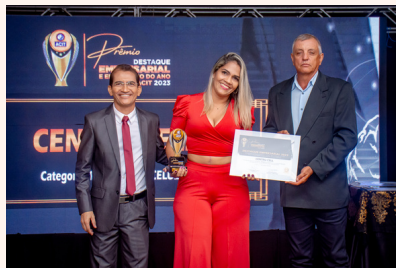
CENTRO CELL Revenda de Celular