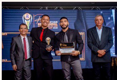
BODY LIFE SUPLEMENTOS Suplemento Alimentar