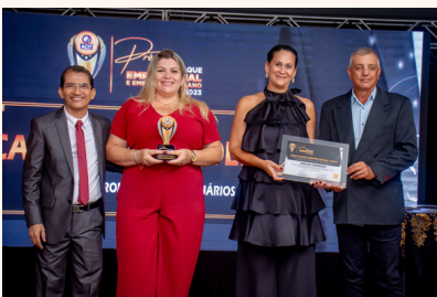
CASA DO FAZENDEIRO Produtos Agropecuários