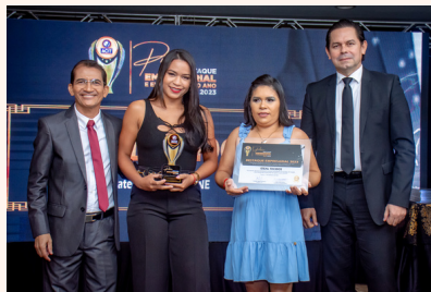
IDEAL TECIDOS Magazine