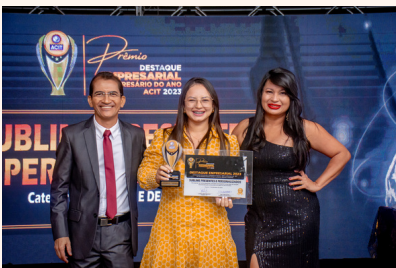
SUBLIME PRESENTES E PERSONALIZADOS Presente e Decoração