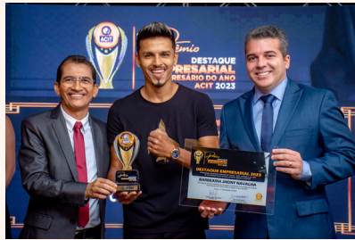
BARBAEARIA JHONY NAVALHA Barbaearia