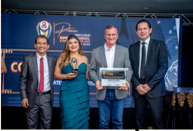
COMERCIAL GOIÂNIA Material de Construção