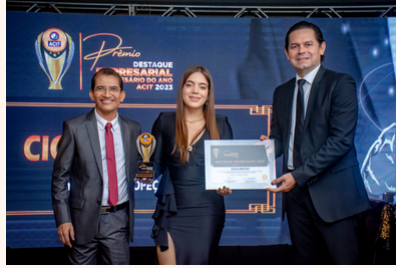
CICLO MOTOS Moto Peças