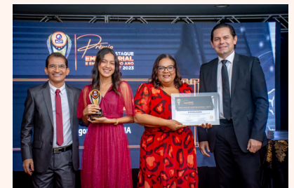
MM MALHARIA Malharia