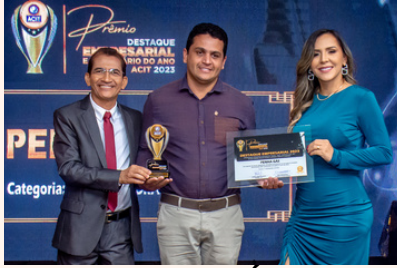
PENHA GÁS Distribuidora de Gás