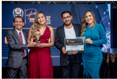
ULTRA POPULAR Farmácia