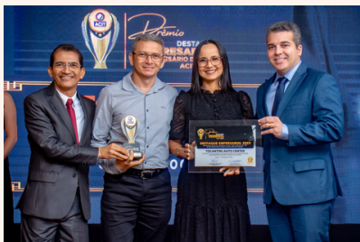
TOCANTINS AUTO CENTER Auto Center