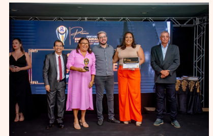
SALÃO ESPAÇO CORPORE Salão de Beleza