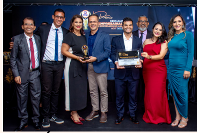
RÁDIO FLORESTA FM Emissora de Rádio