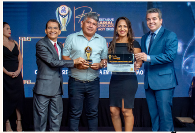
TOCANTINS REFRIGERAÇÃO Assist. Téc. Refrigeração