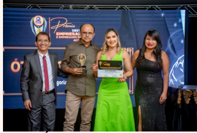
ÓTICA PRIMAVERA Ótica