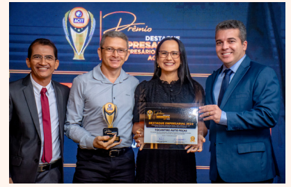
TOCANTINS AUTO PEÇAS Autopeças