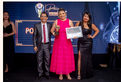
POSTO PETROMAX Posto de Combustível