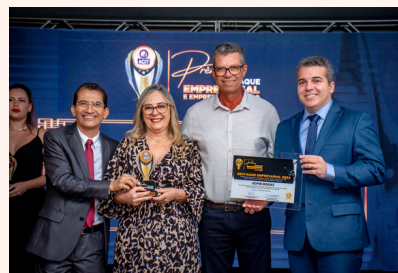
XOPIN MODAS Boutique