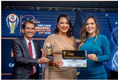
E-SOLAR Energia Solar