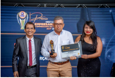
NUTRINORTE Nutrição Animal