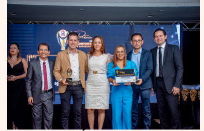
CREDIÁRIO ISABELE Móveis e Eletrodomésticos