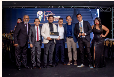
FLORESTA NEWS Portal de Informações e Notícias