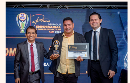
DM MODA ÍNTIMA Moda Íntima