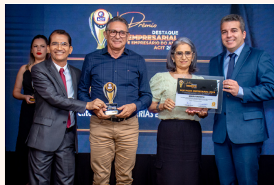
MARIA BONITA Bijouterias e Acessórios