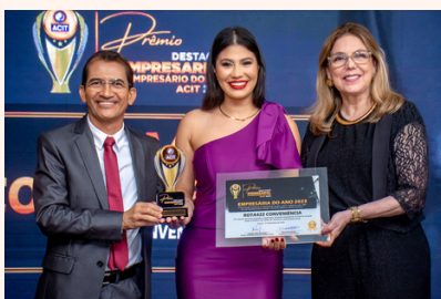
ROTA422 CONVENIÊNCIA Conveniência