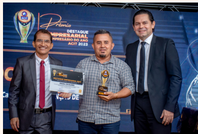
RDCELL CELULARES Manutenção de Celular