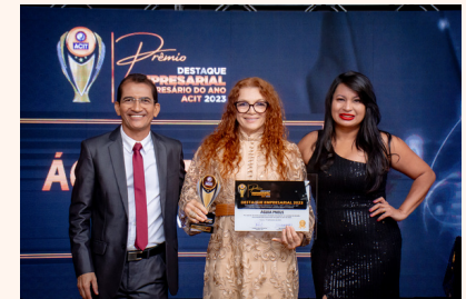
ÁGUIA PNEUS Pneus