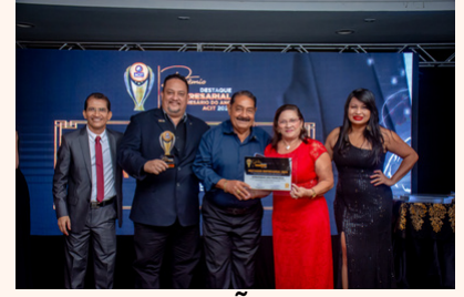
ARMÁRIO SÃO FRANCISCO Papeleria