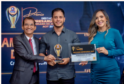
HAMBURGUERIA DO CHEFF Hamburgueria