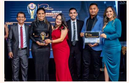
FACULDADE GAMALIEL Faculdade