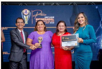
BELEZA VIP Loja de Cosméticos