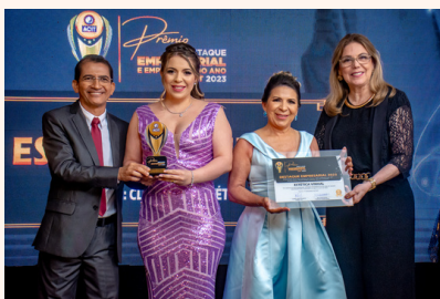
ESTÉTICA VINHAL Clínica de Estética