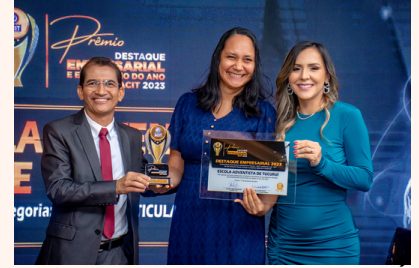
ESCOLA ADVENTISTA DE TUCURUI Escola Particular