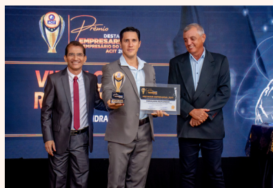
VIDRAÇARIA RESPLENDOR Vidraçaria