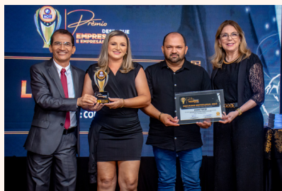
LOJAS TOP 20 Confecções