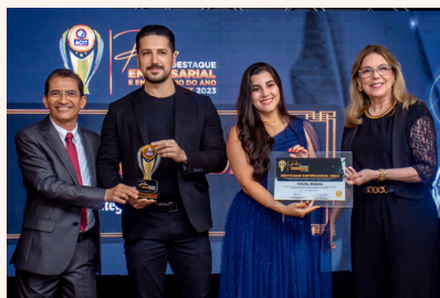
VISUAL MODAS Calçados