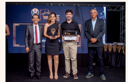
PROVECOM Provedor de Internet