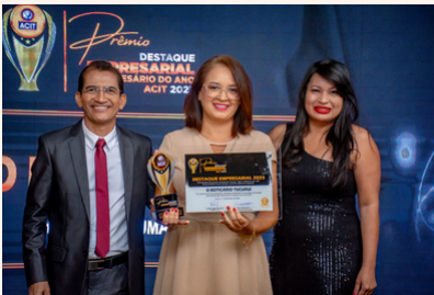
O BOTICÁRIO TUCURUÍ Perfumaria