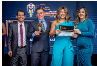
LABORATÓRIO SANTA RITA Laboratório de Análises Clínicas