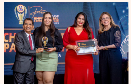
CHURRASCARIA PANELA VELHA Churrascaria