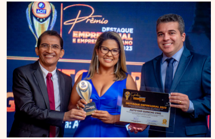
AUTO KAR GUINCHO 24HS Auto Socorro