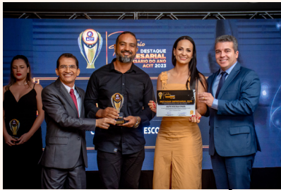
AUTO ESCOLA PARÁ Auto Escola