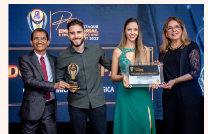
ODONTO COMPANY Clínica Odontológica