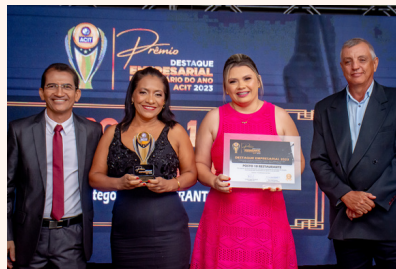
POSTO 10 RESTAURANTE Restaurante