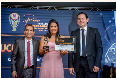
TUCURUI NA REDE Marketing Digital