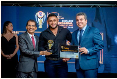
ACADEMIA ESPARTA Academia